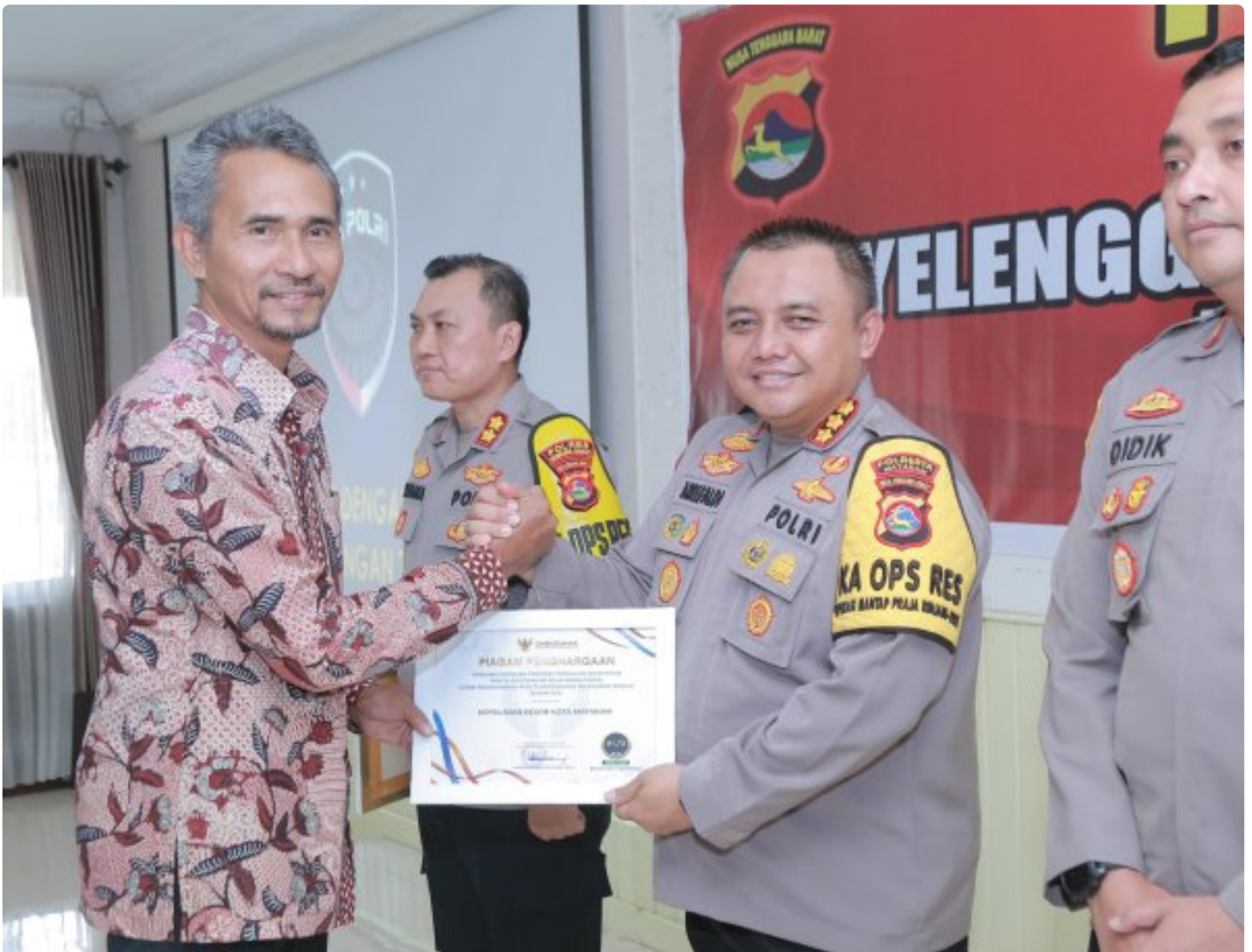
Kapolresta Mataram saat menerima Penghargaan dari Ombudsman RI perwakilan NTB, Kamis (19/12/2024)

MATARAM, NTB – Polresta Mataram kembali mengukir prestasi dengan meraih Predikat Kepatuhan Penyelenggaraan Pelayanan Publik Tahun 2024 dari Ombudsman NTB. Polresta Mataram menjadi salah satu dari delapan Polres/ta